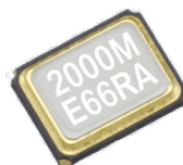
FA-238V / FA-238

製品型番 FA-238V : Q22FA23V0xxxx17 FA-238 : Q22FA2380xxxx17 TSX-3225 : X1E000021xxxx17